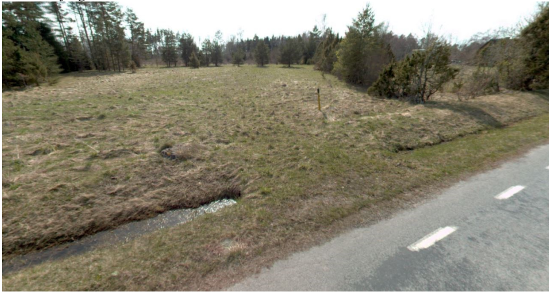
Joonis 1. Riigitee km 26,235 ristumiskoht, tänavavaade aprill 2024

* Riigitee km 26,235 ristumiskohta ei ole vajalik remontida juhul, kui seda ei soovita ehitamise ajal või ehitamise järgselt alaliselt kasutusele võtta.