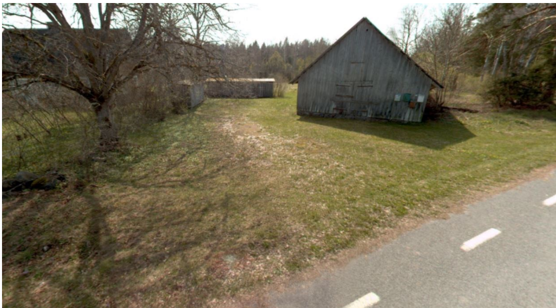
Joonis 2. Riigitee km 26,338 ristumiskoht, tänavavaade aprill 2024